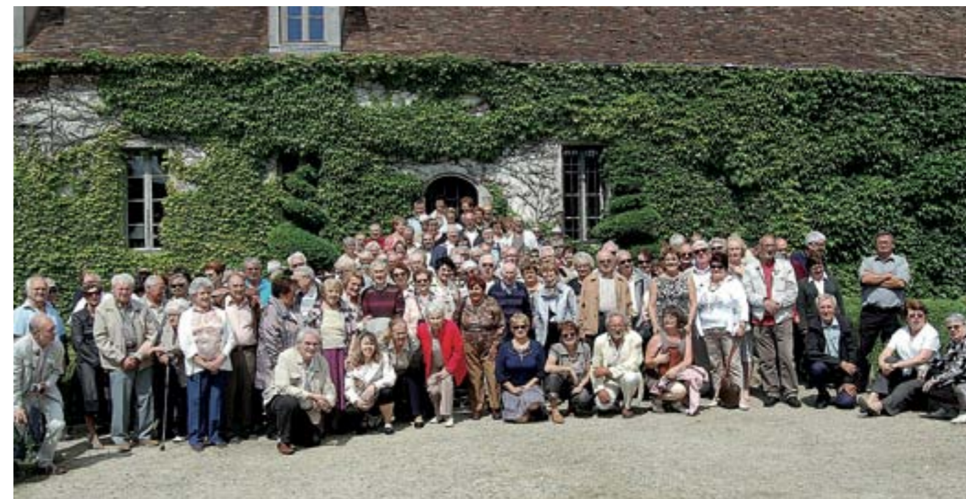
145 ollainvillois réunis pour une sortie au château de Maintenon, suivie d'un repas à la ferme de Bois Richeux, superbe cadre entouré d'un jardin médiéval.