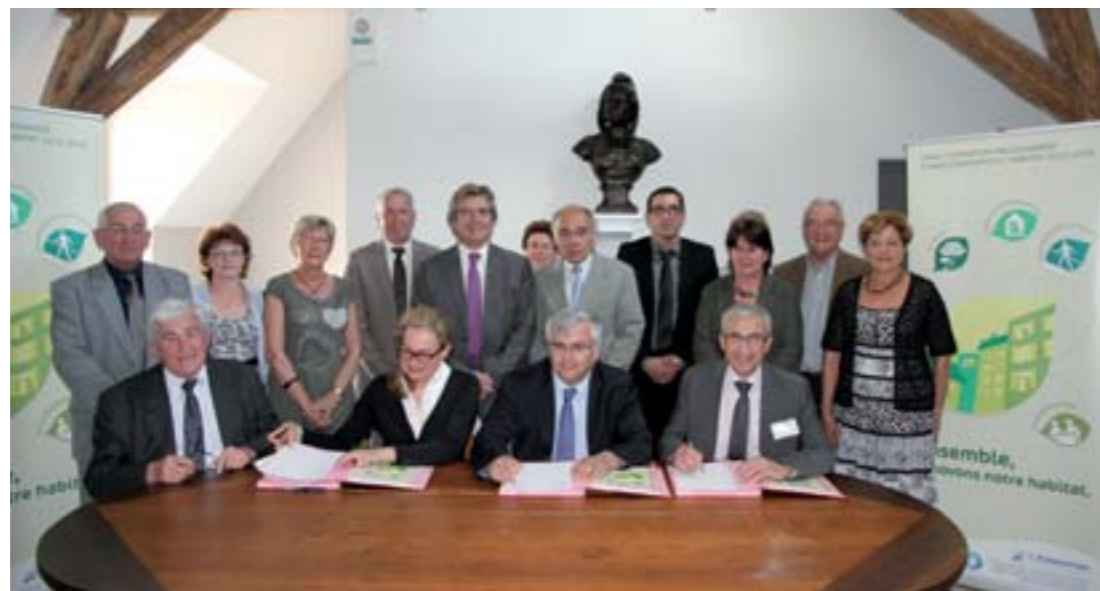
Signature de la convention.

L'enveloppe financière globale est estimée à 2,9 millions d'euros dont 785 666 € portés par la CCA, 367 500 € par les communes, 1,4 million par l'ANAH, 313 275 € par le Conseil Général de l'Essonne (participation estimée) et 120 000 € par le Conseil Régional d'Ile-de-France.