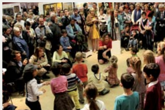
Prestation des Mini-Schools

Comme chaque année, de nombreux prix ont été remis aux exposants :